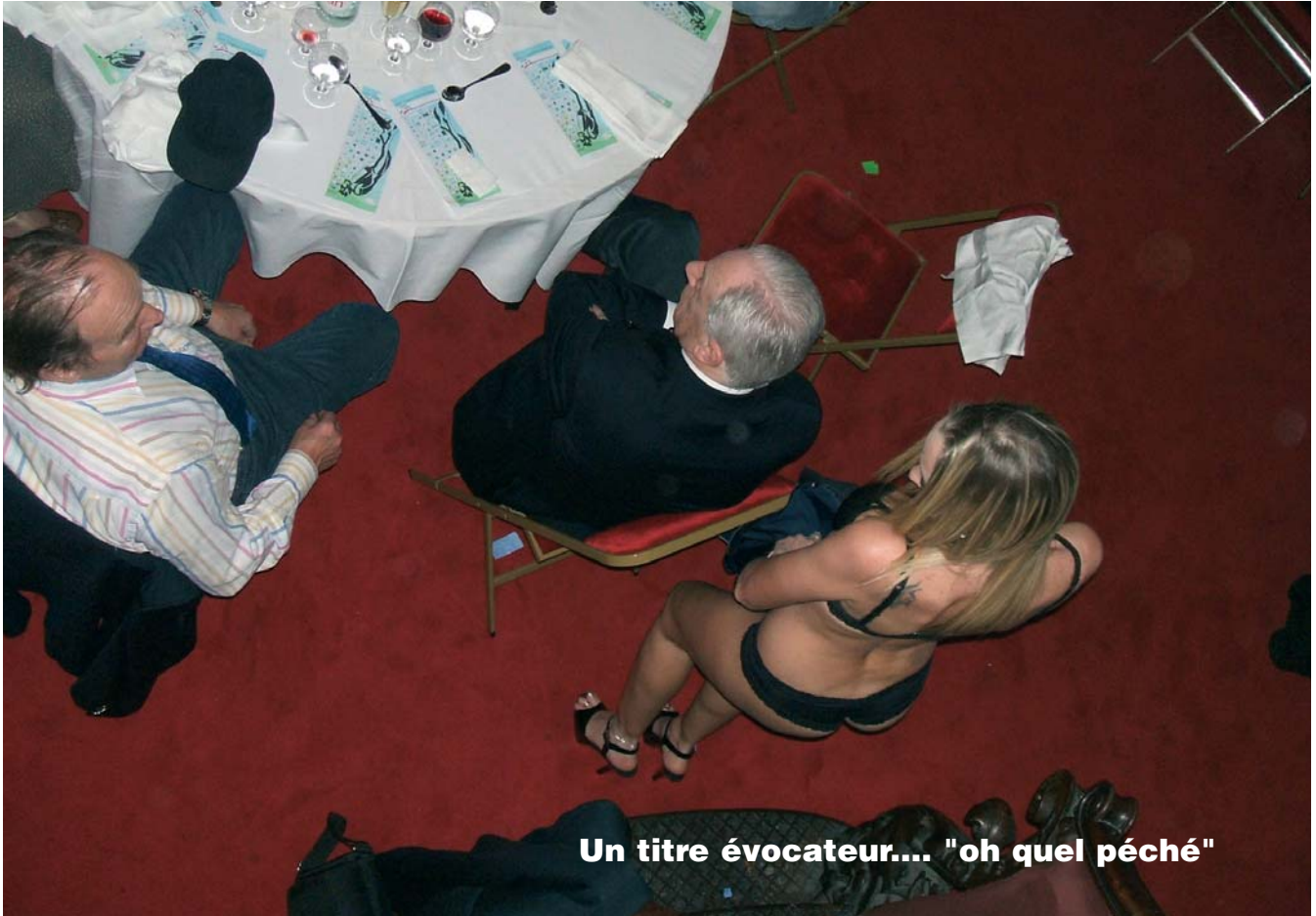
Un titre évocateur... "oh quel péché"

Le Comité Nord/Pas-de-Calais de notre fédération avait décidé cette année de commémorer les 50 ans de plongée dans le Nord.