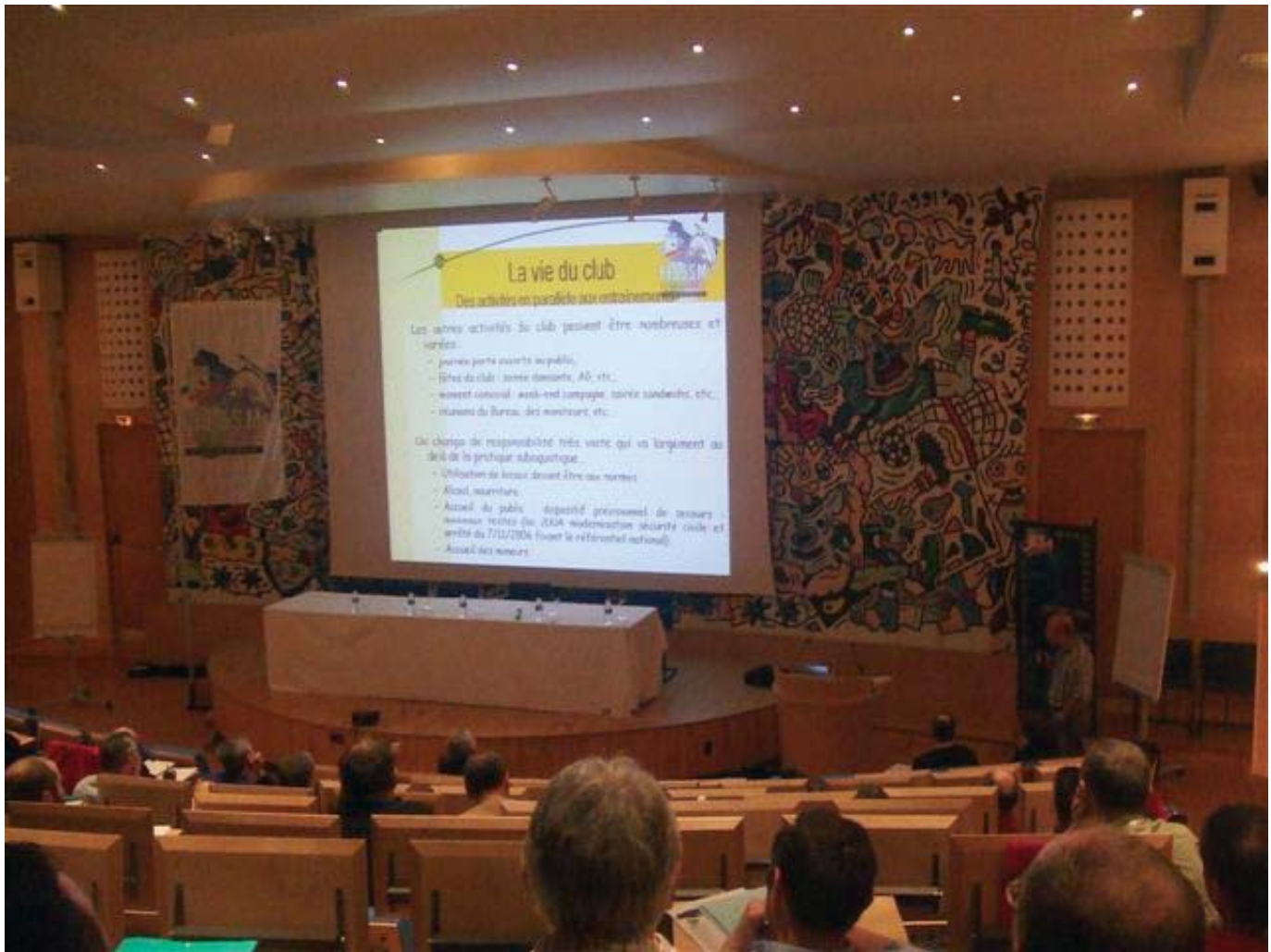
Une salle comble

du Président. De nombreux sujets comme, la surveillance de bassin, l'accueil du public et la réglementation lors de séjour à l'étranger ont été abordés. Parmi les réponses on pourra noter l'utilisation de la VHF comme le seul moyen d'alerte reconnu par le CROSS, mais aussi la possibilité donner l'alerte via le 1616 à partir d'un téléphone portable. Ce numéro est mis en place pour d'éventuels témoins terrestres constatant une situation nécessitant l'appel du CROSS.